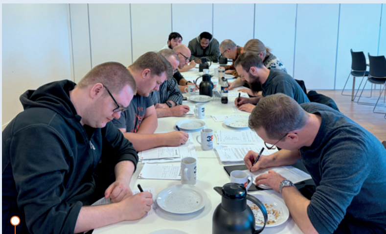
4 ud af de 11 elektriske fra Scandi Byg er allerede i nyt arbejde efter konkuren og flere er på vej.