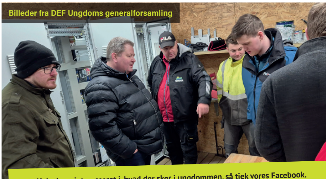
Billeder fra DEF Ungdoms generalforsamling

Hvis du er interesseret i, hvad der sker i ungdommen, så tjek vores Facebook. Du finder os lige HER