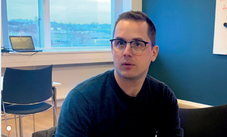
De 11 elektriske bor fra Løgstør i syd til Brønderslev i nord.

– Scandi Byg er den første konkurs sag, som vi har i mere end et år, og lad os håbe, at der går længe, inden vi får den næste sag.